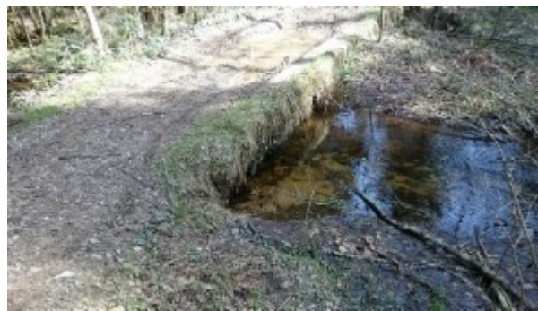
Le petit pont sur le ruisseau de la Proie

Par la suite, le pont qui enjambe le ruisseau de la Proie à cet endroit fut réaménagé par les services forestiers.