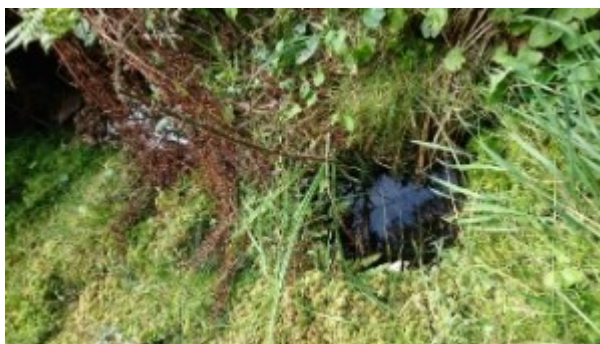
La source ?

De là il nous emmène de l'autre côté de la route, à nouveau via des buses, et se perd dans le fossé après quelques longueurs