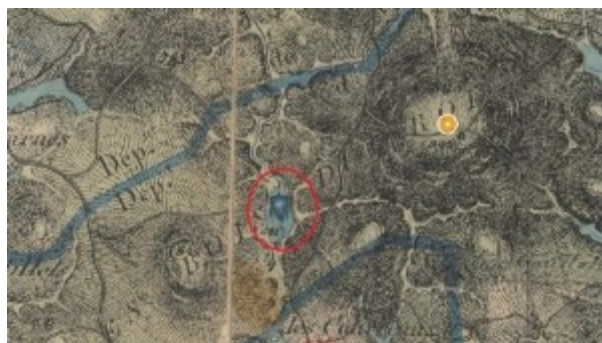
Sur la carte d'Etat-Major (1820-1866), la retenue sur le ruisseau de la Proie apparaît nettement

De nos jours subsiste une modeste retenue, en aval de la première, située en bordure de la « route touristique ».