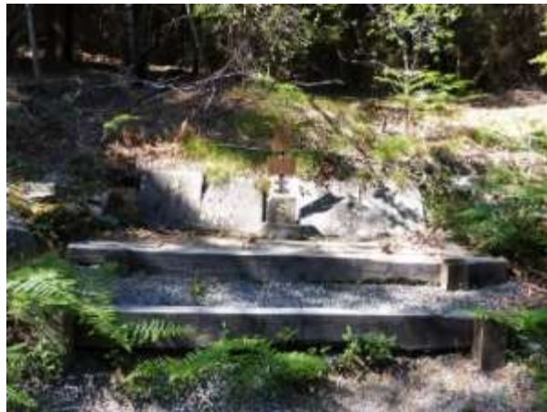
Cette stèle bien modeste est complétée par 2 plaques exposées en Mairie de Saint-Prix.

« Nous avons creusé une plateforme dans la pente, déplacé une borne Schneider qui servait à signaler une conduite d'eau sur le plateau d'Antully, et inscrit tous les noms sur une plaque ».