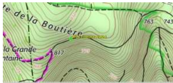
Le lieu exact du crash du B24

- Et, cerise sur le gâteau, le site « Aérosteles » dédié à ce genre de recherche vous localise exactement le lieu : https://www.aerosteles.net/stelefr-stprix_schneider