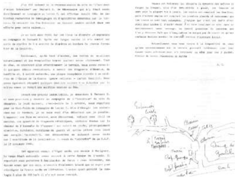
Les noms ne sont pas cités dans ce document accompagné d'un croquis de leurs investigations en 1992