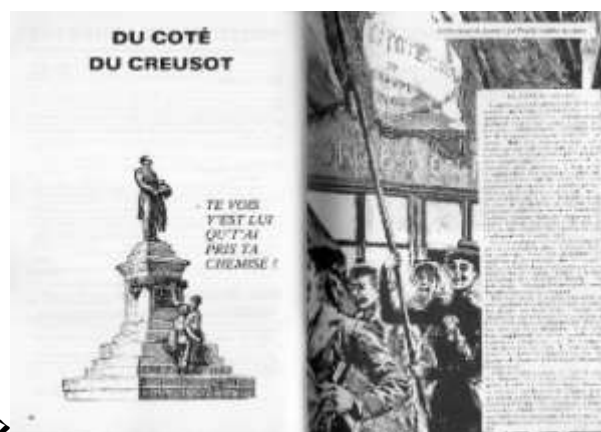
Extrait de l'Almanach 1984-004